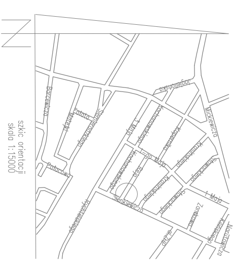
szkic orientacyjny skala 1:15000

Mapa wykonana na 28. 08. 2015 r. Mapę wykonał 02. 09. 2015 r.